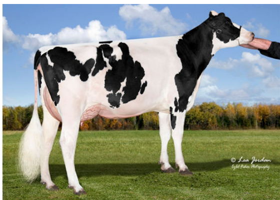
COOKIECUTTER SLM HOPLITE GRANDDAM